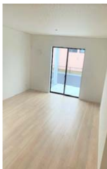
▲②リビングダイニング16帖